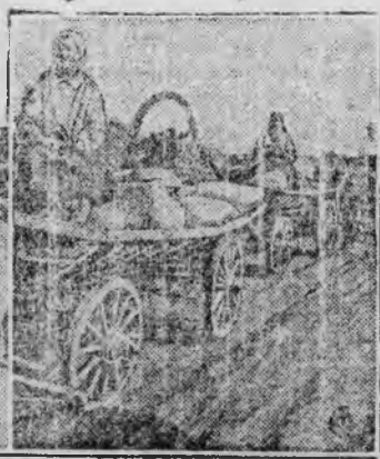
На снимках: С права—красным обозом везут хлеб колхозницы, слева единоличник сдает хлеб на элеватор.